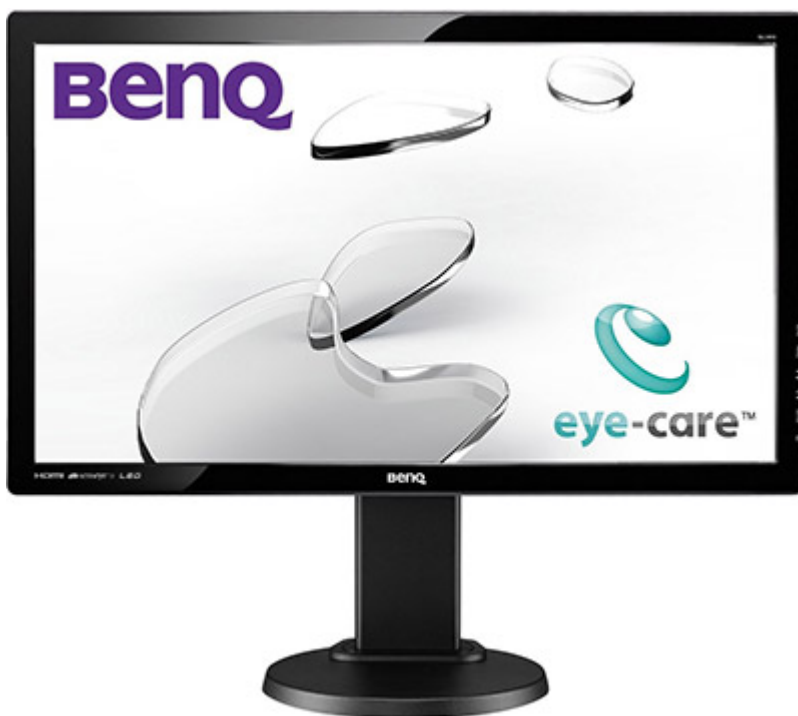
BenQ GL2450HT

Um 14:00 Uhr geht ein Monitor an den Start. Es handelt sich um den 24 Zoll Full HD Monitor BenQ GL2450HT in schwarz mit HDMI, DVI, D-Sub, 2 Millisekunden Reaktionszeit, LED Hintergrundbeleuchtung, TN Panel, 1000:1 Kontrast und einer maximalen Helligkeit von 250 cd/m 2 . Außerdem bietet er eine Höhenverstellung, Neigefunktion, seitliche Drehfunktion und Pivot. Die bisherigen Amazon Wertungen sind positiv. Der momentane Preis beträgt 165,01 Euro. Hier geht es zum Angebot!