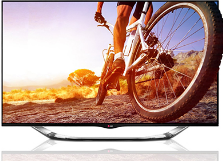
LG 42LA8609 (Bild: LG)